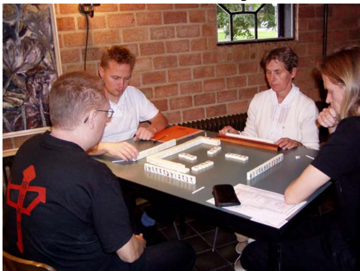
Vi tre danskere mødtes ved samme bord i femte runde

Selve turneringen blev afholdt ca. en times kørsel fra Nijmegen, og startede kl. 11.00. Turneringsformen var noget anderledes end vi er vant til. Nemlig 6-runder af 50 minutter, hvor man i hver runde ikke startede end ny hånd efter det 40. minut. Øst gik ikke automatisk videre, så hvis man ikke nåede vinderen færdig, så var det bare surt.