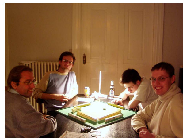
Copenhagen Open 2003: Finalen